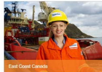
East Coast Canada