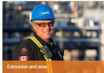
Edmonton and area