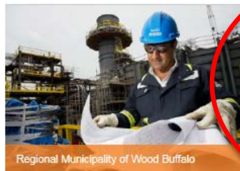
Regional Municipality of Wood Buffalo